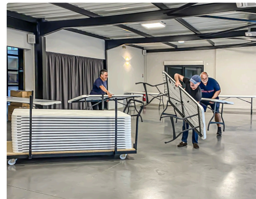
Avant la séance, mise en place du mobilier12 DRRolande MEP du mobilier 1bis 220822.jpg