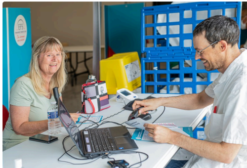
5e étape : consultation