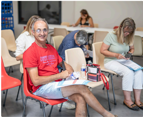
4e étape : attendre la consultation avec un médecin