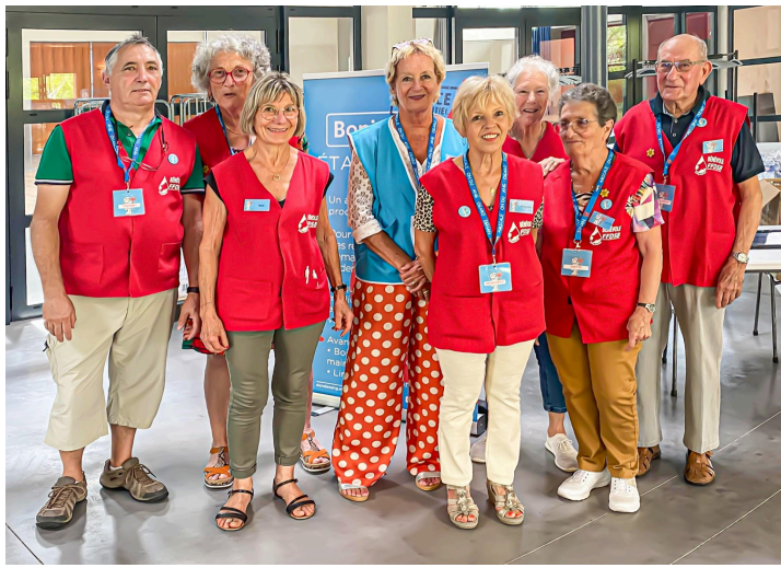
L'équipe de DSNA de 15 heures à 19 heures

Sans oublier que des donneurs habituels n'ont pas pu venir pour raison de santé et n'ont pas manqué d'en avertir DSNA.