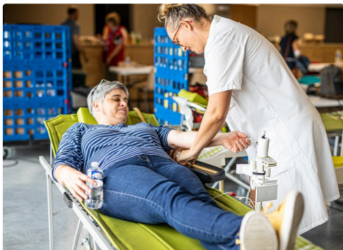
Autre personne qui donne son sang