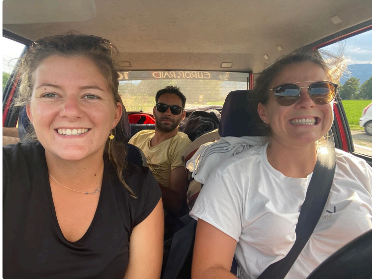
Suite du périple de l'équipage EUFASO : Roumanie, Hongrie, Slovaquie, Pologne, Tchéquie

L'aventure de l'équipage EUFASO est terminée depuis une bonne semaine.