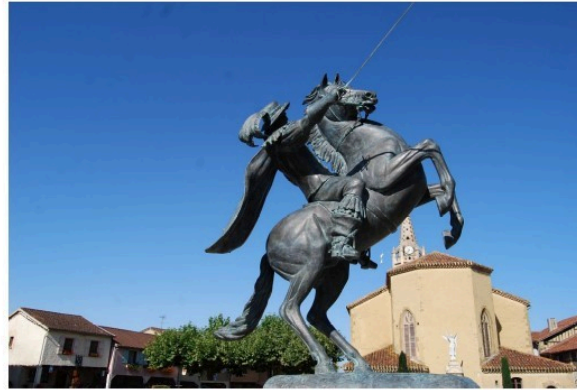
L'été n'est pas fini à Lupiac !

L'été touche à sa fin mais les animations ne sont pas terminées à Lupiac !