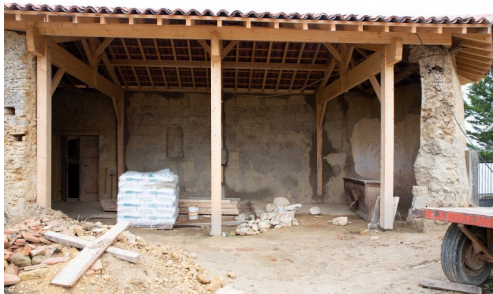
Église de Daunian avant les travaux