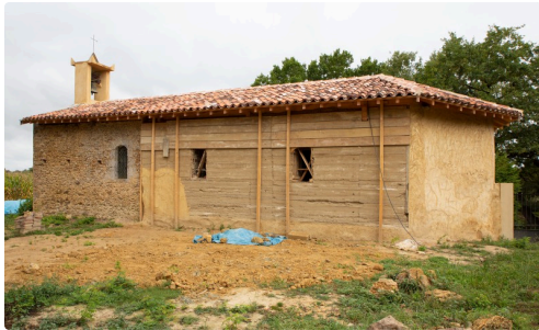
Église de Daunian pendant les travaux