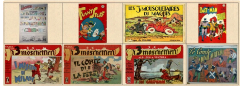
Couvertures de BD dans le site "pastichesdumas.com"