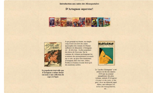
Couvertures de livres dans le site "pastichesdumas.com"