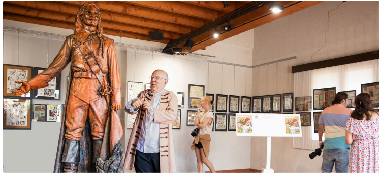
Qui est d'Artagnan, le vrai- né à Lupiac - ou le mythe universel?