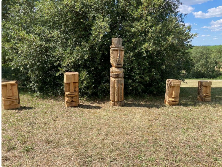
Quand un village se transforme le temps d'un week-end en une galerie d'art, c'est Art à Roques !

Le rideau est tombé sur la session 2022 d'Art à Roques !