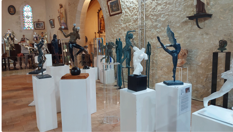
A voir absolument ! Encore une semaine pour profiter du festival Avoz'art !

Le festival de sculpture atypique Avoz'art qui a débuté samedi dernier dans le petit village de Mourède se poursuit jusqu'au 16 août inclus.