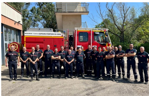
Les pompiers de retour de l'Aude

Un mois de juillet, on le voit particulièrement rude.