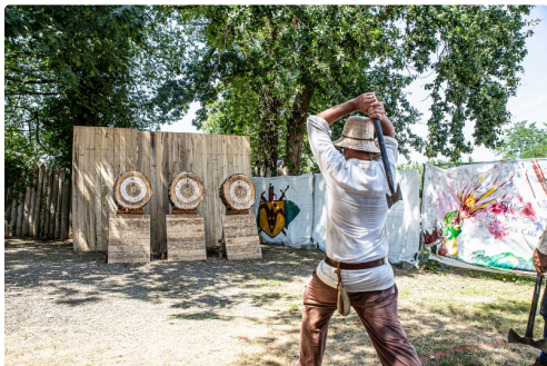
Lancement de hache ( en 2019)