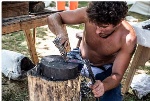
Le forgeron en 2019)