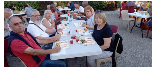
Des Durannais étaient venus en voisins.