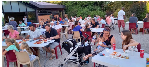
Les convives avant la séance de cinéma.