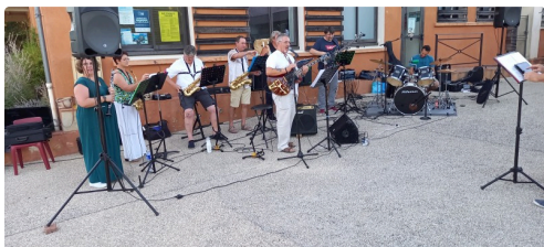
Un orchestre a égayé la soirée.