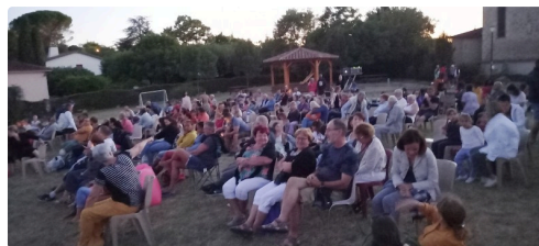
Les spectateurs lors de la séance de cinéma.