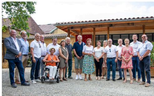
Hôtes et visiteurs