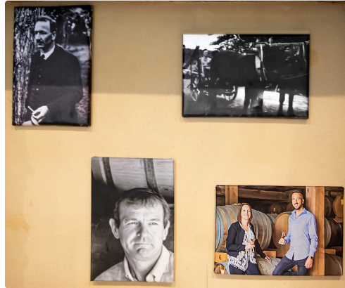
4 générations de la famille Gessler