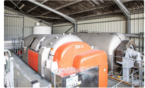
Pressoir pneumatique et pressoir à rouleaux