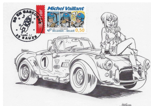
Carte créée par Kring.

Les personnes désirant envoyer du courrier pourront le faire via une enveloppe créée pour l'occasion confection, affranchis du timbre Alain Resnais et oblitérée du tampon philatélique d'Auch en date du 7 août 2022.