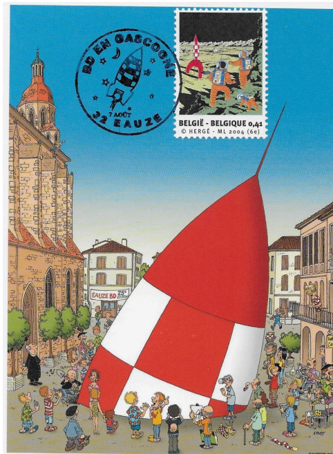
Carte créée par Ernst.