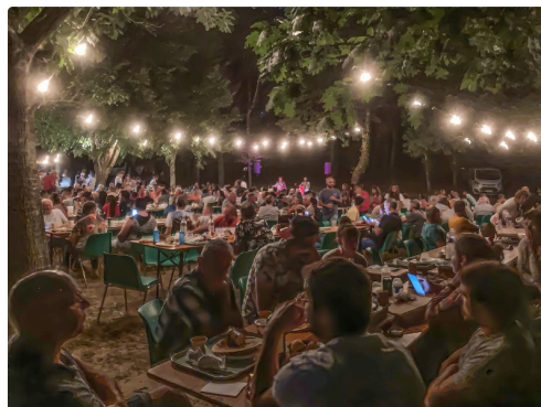
Le repas du 23 juillet