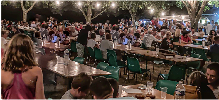
Une première belle soirée de l'été au Houga...suivie par une 2e

De beaux souvenirs à renouveler vendredi 5 août