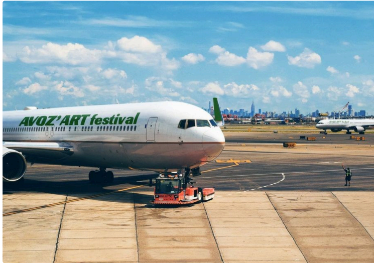
Le festival de sculpture Avaz'Art ouvre ses portes samedi : rencontre avec sa présidente !

A pied, à vélo, en voiture... ou même en avion privé spécialement affrété pour l'occasion ( !!! ), tous les modes de locomotion sont bons pour se rendre au festival Avoz'Art qui ouvre ses portes samedi 30 juillet à 10 h à Mourède !