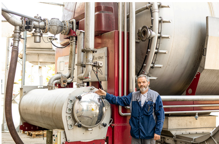
Un grand pressoir pneumatique