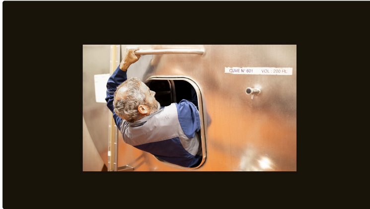
Urgent: Plaimont cherche des saisonniers francophones pour la vinification

Pour les Caves d'Aignan, de Saint-Mont et de Plaisance-du-Gers (mis à jour le 28 juillet)