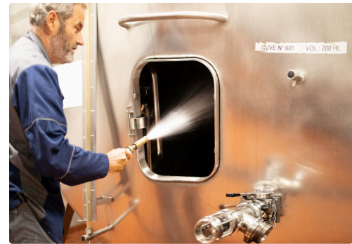
Nettoyage d'une cuve