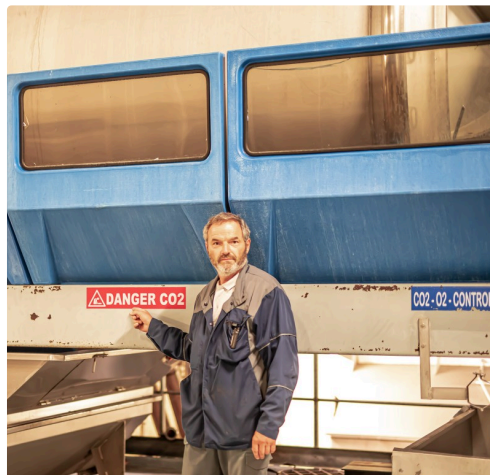
Affiches de sécurité