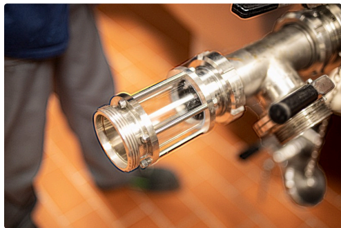
Conduite avec partie en verre pour contrôler le goût