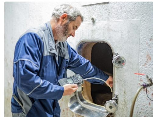
Mesure du taux de CO2 dans une cuve