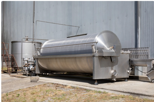
Filtre de débouillage

Pour faire acte de candidature, il faut appeler au 05 62 69 66 76 ou envoyer un courriel à ( recrutement@plaimont.fr ).