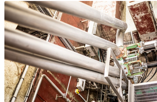
Dispatching du moût vers différentes cuves