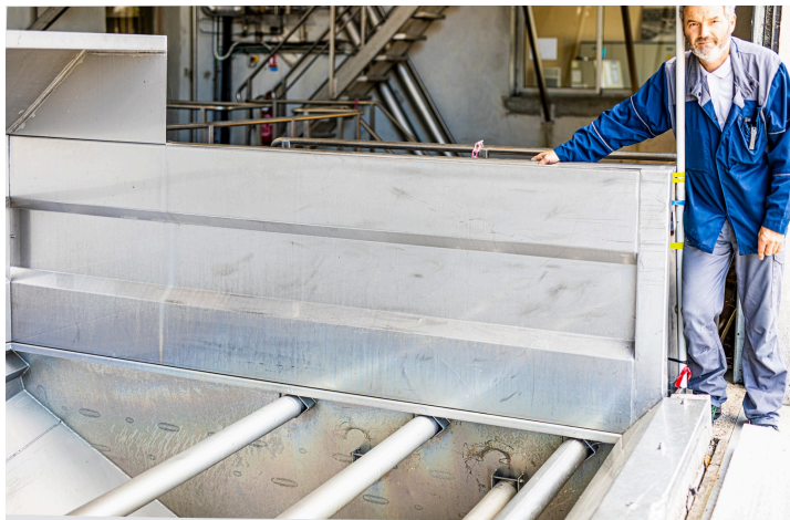
Le lot de raisin est vidé dans le conquet peseur

Il faut aussi contrôler la teneur en CO2 dans les cuves, les nettoyer et s'assurer que tout tourne comme sur des roulettes !