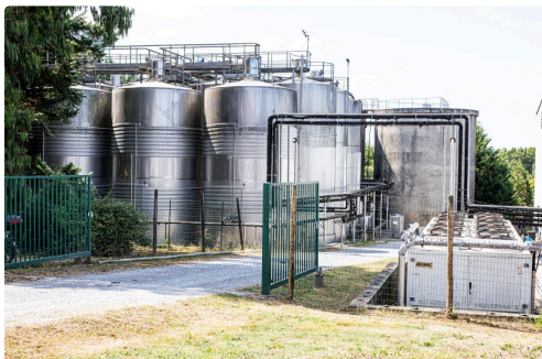
Parmi les cuves de la Cave