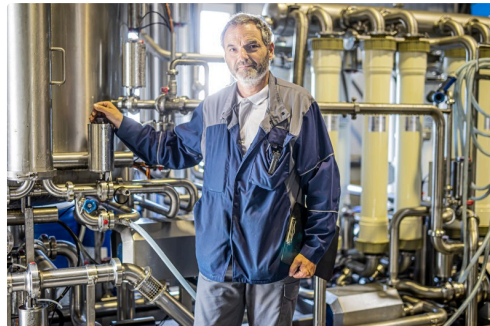
Filtre à céramique dernier cri