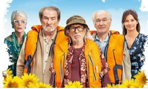
Sortie le 17 août du film "Les Vieux Fourneaux 2 : bons pour l'asile " tourné dans le Gers !

Le Journal du Gers vous en parlait au mois d'octobre :