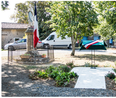
Site du pupitre avant dévoilement