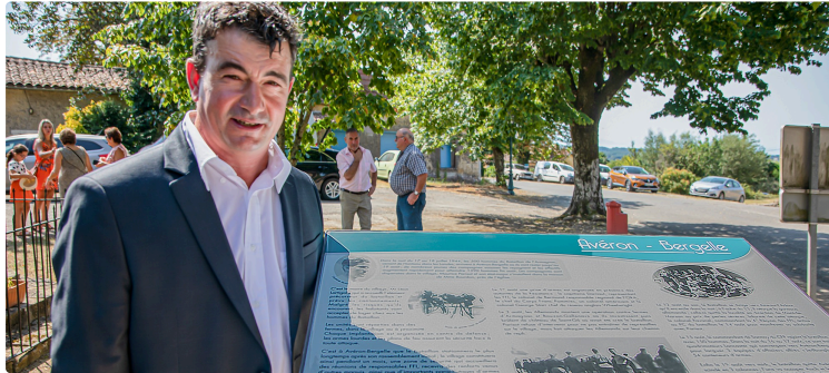
Cérémonie sobre et prenante pour le « Haut lieu de mémoire » d'Avéron-Bergelle

Dévoilement d'un pupitre en présence de nombreuses personnalités