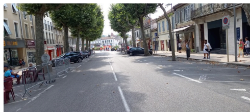
L'avenue Alsace étrangement calme ce matin 22 juillet à 11 heures.