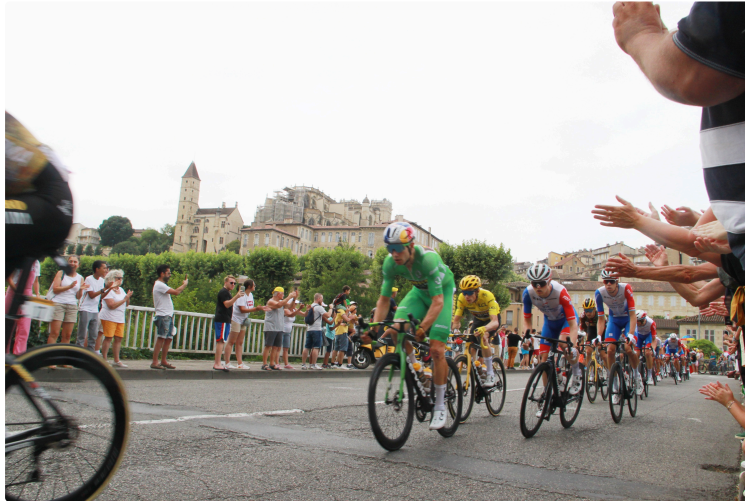
Tour de France : toujours le même engouement

Des individus ont bloqué la course quelques minutes, ils sont en garde à vue.