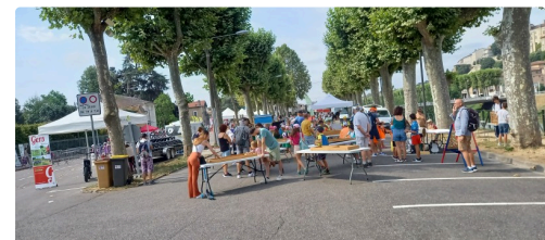
De nombreuses animations.