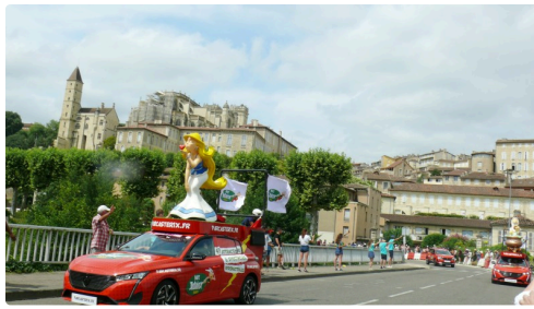
Falbala aussi était là...