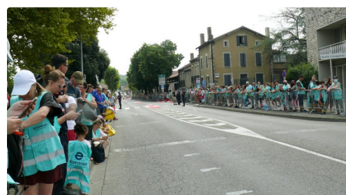
Les spectateurs avenue Hoche.