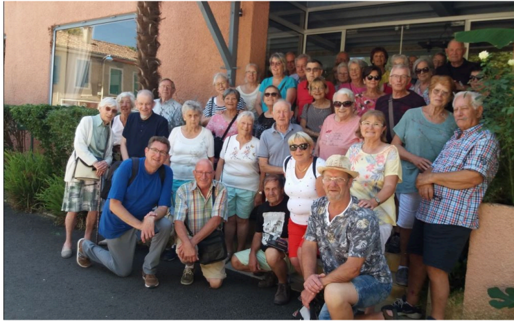
Une belle étape touristique

La saison touristique est déjà bien entamée et l'hôtel des Thermes connaît une certaine effervescence.