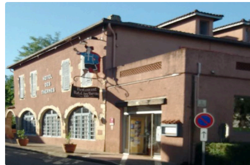
hotel castera verduzan.JPG