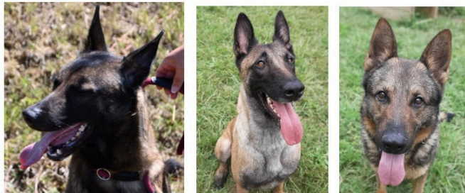
Deux belles Malinoises et un beau Berger allemand cette semaine !

Cette semaine, la SPA met à l'honneur trois animaux arrivés il y a quelques semaines au refuge, Mamy et Tiana, deux Malinoises, et Loukie, un Berger allemand.