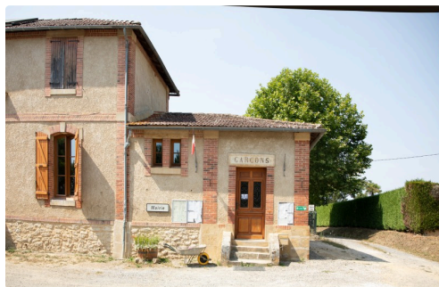
La mairie : 2 pièces au rez-de-chaussée

Le 15 juillet, le maire, Christian Priouzeau accompagné de son prédécesseur et adjoint, Gérard Fitan, nous ont fait visiter les deux pièces de la mairie. Le sol et les murs ont été refaits de manière à éviter les remontées d'humidité. Le sol a été refait en carrelage monté sur une base de pierre. La chaux a été employée systématiquement comme base d'enduit sur les murs et pour le mortier.