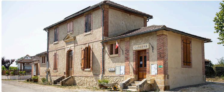
Pouydraguin fait la fête avec une mairie rénovée

Exposition de peinture, repas traditionnel, soirée musicale, randonnées pédestre et équestre