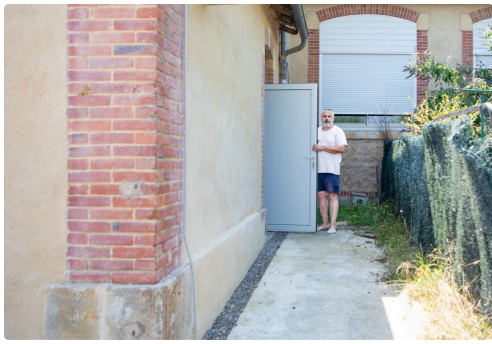
Bertrand Priouzeau montre la rampe qui rend la mairie accessible aux handicapés