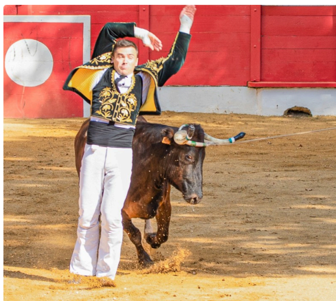
10 Ecart 1bis 140722.jpg