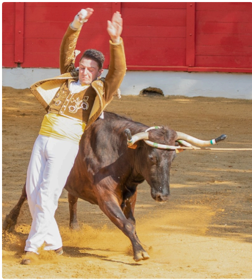
12 Ecart 1bis 140722.jpg