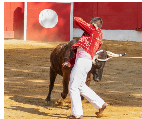
11 Ecart 1bis 140722.jpg