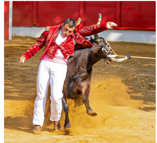
18 Ecart 1bis 140722.jpg