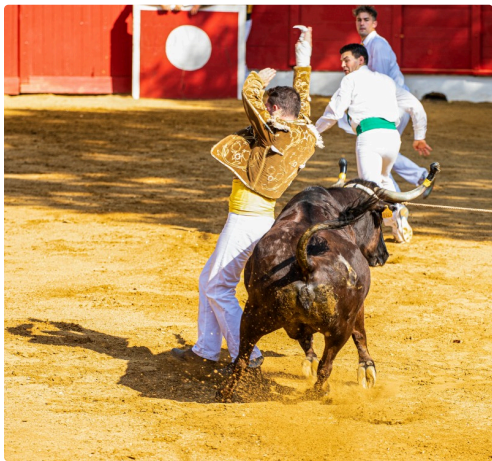
19 Ecart 1bis 140722.jpg