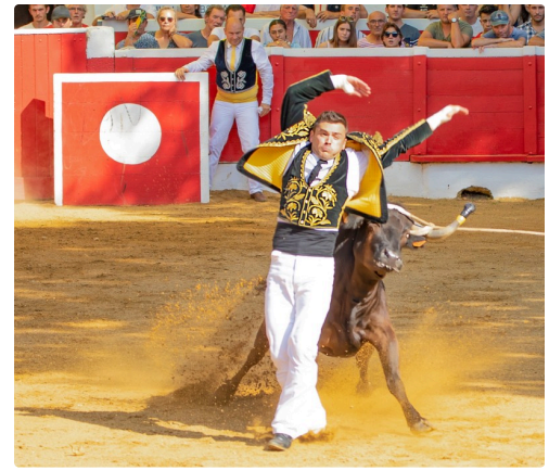
15 Ecart 1bis 140722.jpg