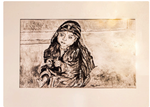
Pastel (c'est un sous-verre, d'où des reflets à droite...)