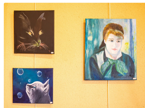
Chats et jeune fille