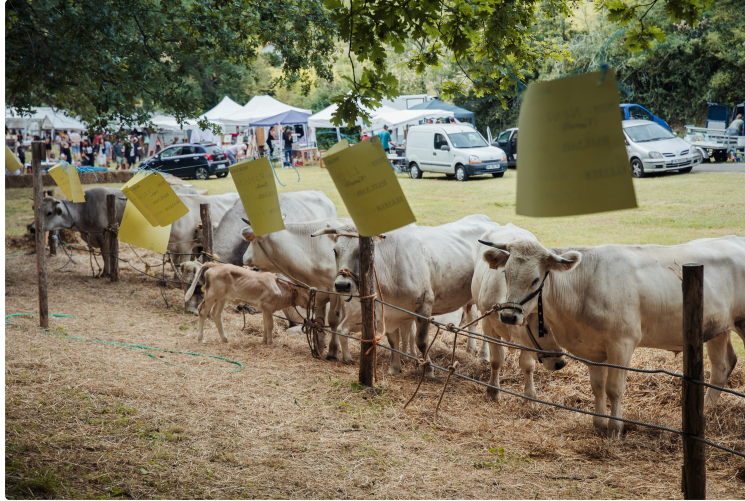
La traditionnelle Foire de la Madeleine vous attend dimanche à Montesquiou pour sa 4ème édition !

L'Association Foire de la Madeleine présente