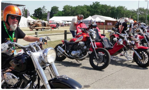
country sb 459.JPG