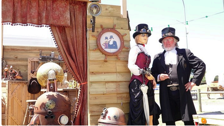
Country demain ce sera trop tard

Si vous avez manqué les trois premiers jours ne loupez pas cette ultime occasion de renouer avec la Country mirandaise ou de la découvrir.