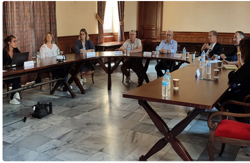
mairie pitchous convention.jpg