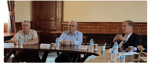
mairie pitchous convention 2.jpg