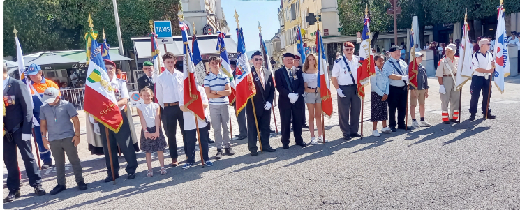
Cérémonie du 14 juillet : une certaine solennité devant un public plutôt confidentiel

C'est sous un soleil de plomb, il fallait s'y attendre ce jeudi 14 juillet sur le coup de 11 heures, que se déroula place de la Libération, la commémoration de la fête nationale. Celle-ci fut suivie par un public plutôt confidentiel, ce qui n'empêcha pas de lui donner une certaine solennité.