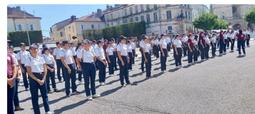
Les jeunes SNU