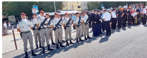
Le piquet d'honneur du premier régiment de train parachutiste de Toulouse