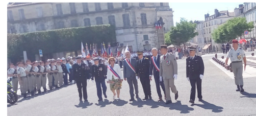
Arrivée des personnalités.