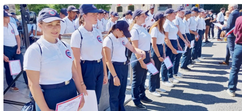
Ils viennent de recevoir leurs diplômes.