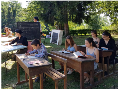
Répétition : à l'école

N.B. - Sur la photo du haut de page : la motte castrale.