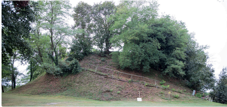
Dernière minute ! «Si Sainte-Christie (d'Armagnac) m'était conté» le 14 juillet

Une pièce de 2 Saintchriotois retrace la vie sous l'occupation et l'immédiat après-guerre