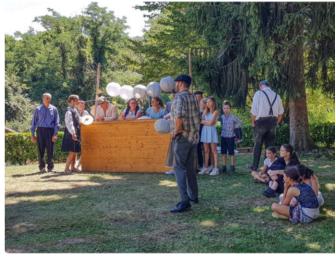
Répétition : la fête