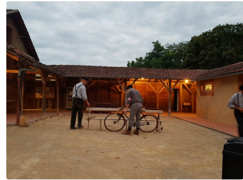
Répétition : les maquisards