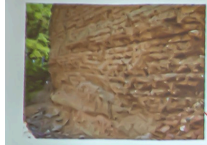
Mur en terre nord

LE REMPART OCCIDENTAL (L. SOULARD, A. KLEIN, C. CAMMAS)