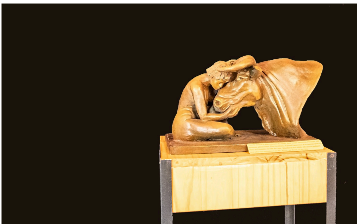
"Le Minotaure" (1er prix du jury) de Bernard Brochard