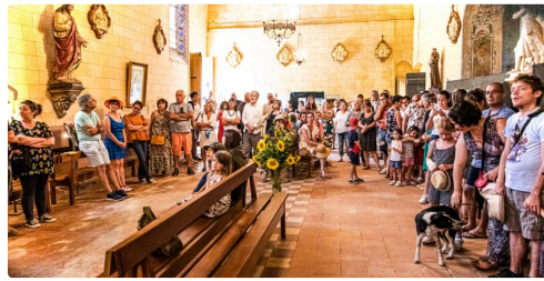
15 L'assistanc 1bis 020722.jpg