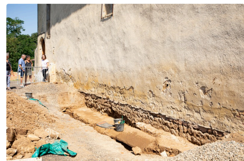
Sondage en cours au pied de l'église de Sainte-Christie