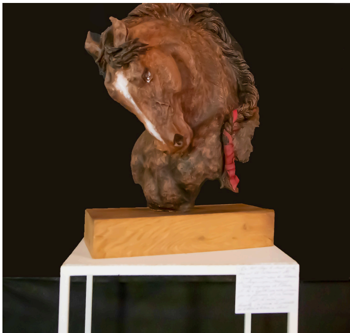
Tête du cheval El Kebir en grès (prix du public)