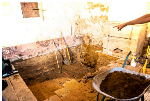
Sondage en cours dans la sacristie