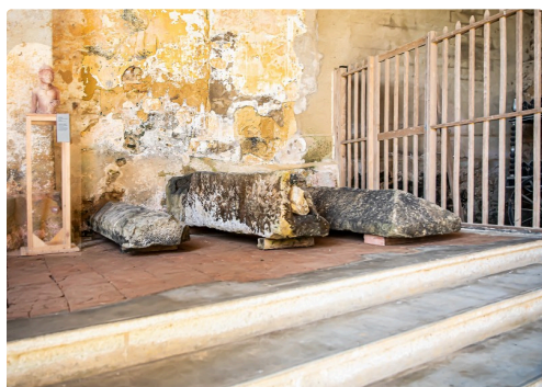
Sarcophages à l'entrée de l'église