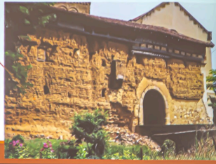
En haut à droite, structure du rempart de terre crue (document projeté par Alain Champagne)

Les fouilles actuelles cherchent s'il n'y a pas dans l'église et/ou à l'extérieur de celle-ci des sépultures mérovingiennes ou carolingiennes.