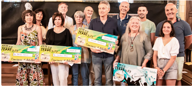
C'était la 1e Fête du matériau «terre» à Sainte-Christie-d'Armagnac

Tout ce qu'on peut faire avec elle pour pas cher en adaptant des techniques anciennes