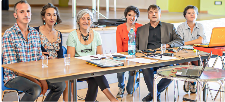
« Les Racines de Naoucrouts » veulent dire leur mot sur l'aménagement de la forêt d'Aignan

Le plan d'aménagement de l'ONF approuvé par le Conseil municipal ne leur convient pas