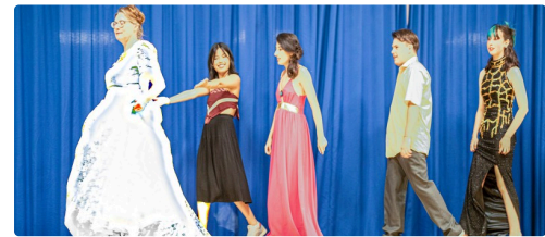
00 6 mannequins.jpg