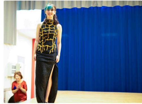
5 Mannequin 1bis 250622.jpg