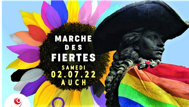
L'enthousiasme de la marche des fiertés