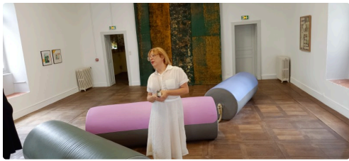
Floating Minds, une oeuvre de Florence Doléac.