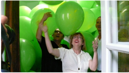
Martin Creed propose Half the air in a Given space