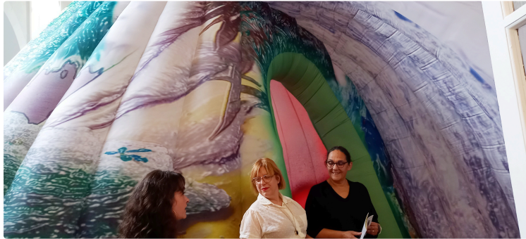
Memento, quinze artistes participent à l'exposition "Résidence secondaire"

Mercredi 6 juillet ouvre la programmation de la série "Les mercredis de Memento"