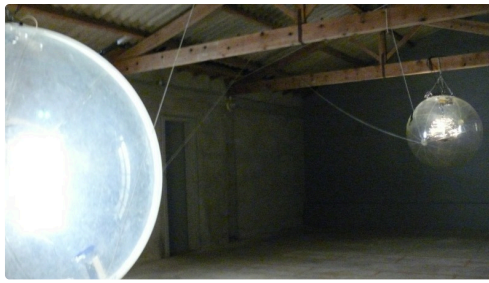
Une oeuvre de Vivien Roubaud.