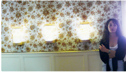
Les faiseuses d'anges de Ilazki de Portuondo