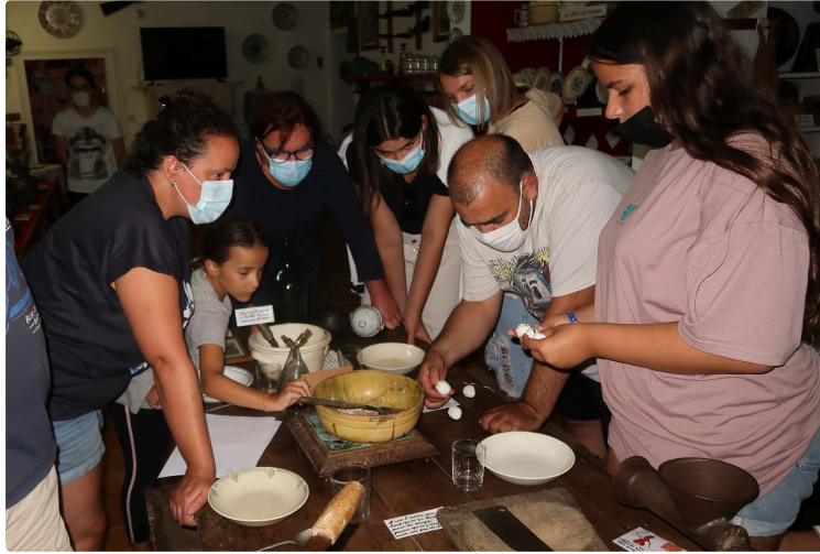
Escape Game, qu'es aquò?

Escape Game, qu'es aquò ? C'est un jeu d'évasion, mêlant énigmes et patrimoine. Il a lieu dans l'enceinte du musée, au milieu des collections, dans l'objectif de mettre le patrimoine à la portée de tous. Parfait pour (re)découvrir le musée !