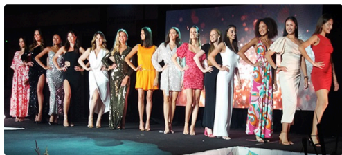
miss gers présentation.jpg

Les huit Miss élues sur le territoire de l'ancienne région, Midi-Pyrénées et leurs premières dauphines, concourront le 3 septembre à Villemur sur Tarn pour tenter de décrocher la couronne régionale, et, pouvoir ainsi poursuivre leur aventure vers le titre tant convoité de Miss France. Le rendez-vous est déjà pris pour l'élection 2023.