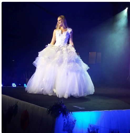
miss gers mariee robe 2.jpg