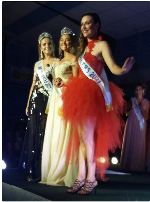
Miss Gers 2022, sa 1ere dauphine et Miss Gers 2021