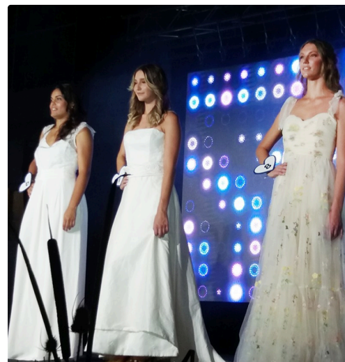
miss gers 3.jpg