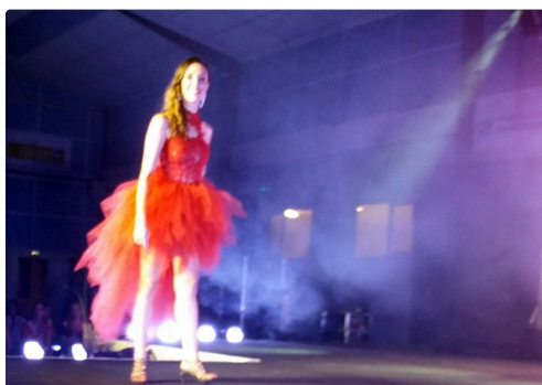
miss gers rouge.jpg