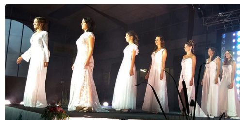
miss gers defile.jpg