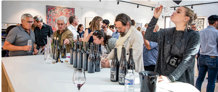
(III) Des experts de la vigne aux Journées ampélographiques de Plaimont

Piémont (Italie), Arménie, Sonoma (Californie) etc.