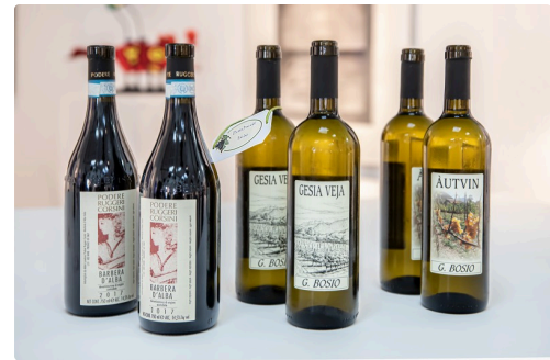
Vins italiens cépage Barbera et cépage Baratuciat