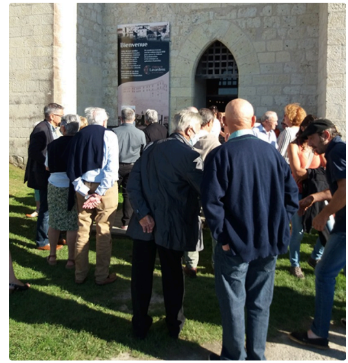
Beaucoup de monde pour découvrir les plaisirs simples