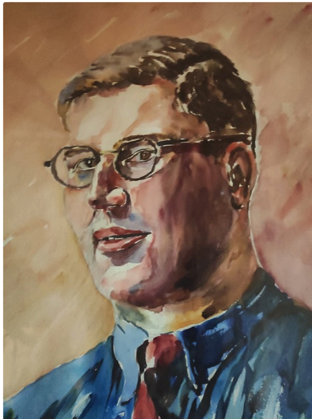
A la recherche des tableaux d'Antoine Schyrgens