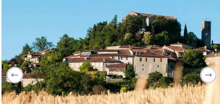
"L'Escapada deu Baselic", escape game autour de l'occitan dans les ruelles du village perché

Forts du succès remporté par l'escape d'Artagnan l'été 2021 à Montaut les Créneaux, l'idée d'appliquer le même concept de jeu a germé non seulement pour Castelnaud- Barbarens, dès juillet, mais aussi pour les communes de Fourcès, Mauvezin et l'Isle-Jourdain durant l'été.