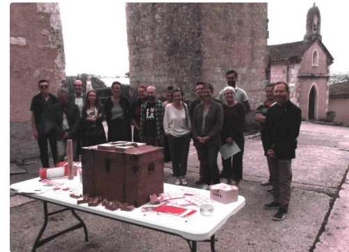
Les partenaires qui ont oeuvré au projet.