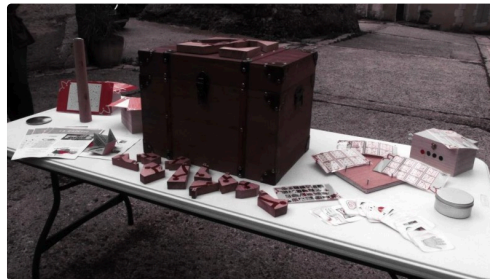
Le coffre et les éléments pour participer au jeu.