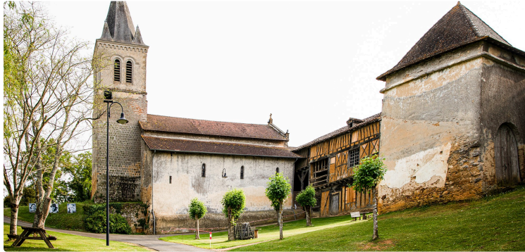
Fête de la terre à Sainte-Christie-d'Armagnac

Le village de Sainte-Christie-d'Armagnac se lance dans une belle aventure : la création d'une Fête de la terre. Celle-ci est prévue pendant 2 jours, le samedi 2 et le dimanche 3 juillet 2022 sur le site du Castet et de la Manse, c'est-à-dire là où ont lieu la plupart des événements festifs du village.