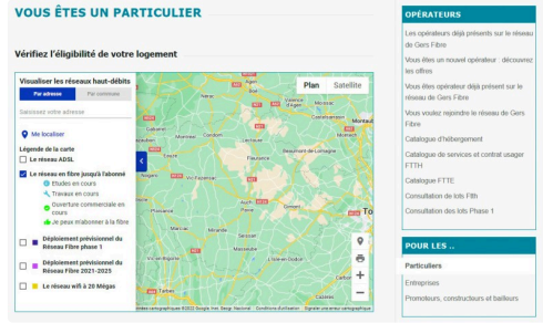
Page du site de "Gers fibre" où l'on peut chercher sa commune