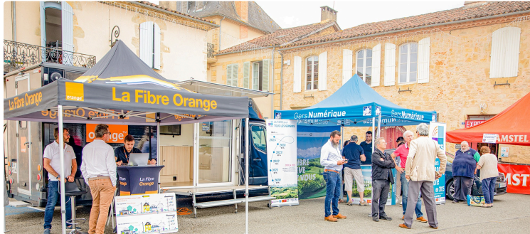
Le « Projet fibre gersois » s'est manifesté à Aignan

Il promet 100 % de fibre optique en 2025 dans le Gers