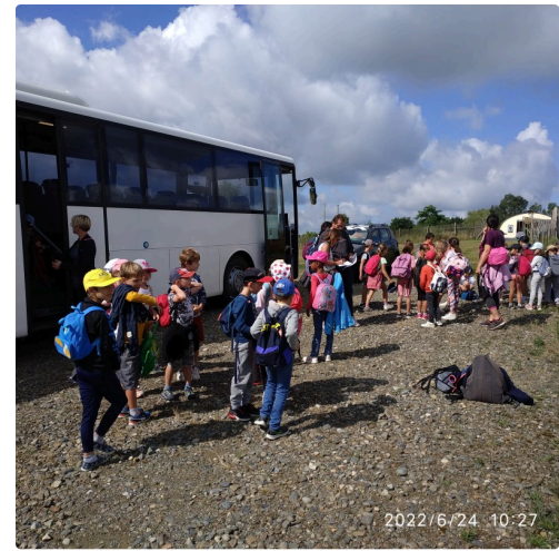
arrivée au parc.jpg