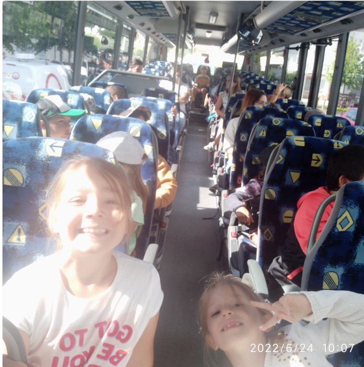
Marciac: en route pour Madiran.