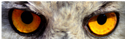
sortie scolaire Madiran