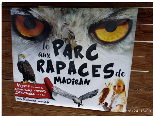
affiche du parc