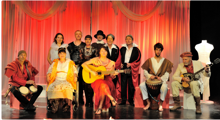
THOUX - LE TH