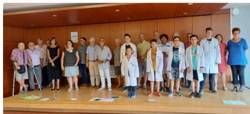
Les enfants et leurs professeurs.

Renseignements et inscriptions au 06 87 50 28 92.