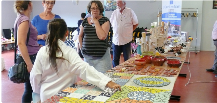
Une après-midi de prestige pour les enfants de "L'Outil en main"

Ils ont présenté leurs oeuvres à l'Ecole des métiers