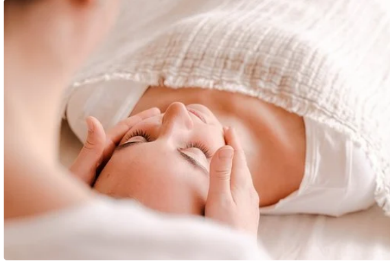
7ème Salon du Bien-Etre

C'est le 17 juillet que l'association TDMV organise pour votre bien-être et votre mieux-vivre le 7ème SALON DU BIEN-ETRE.