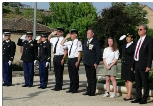
mirande 18 6 5.JPG