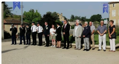
mirande 18 6 3.JPG

Une cérémonie toute simple mais, qui en ces temps perturbés, revêtait un caractère plus prégnant .