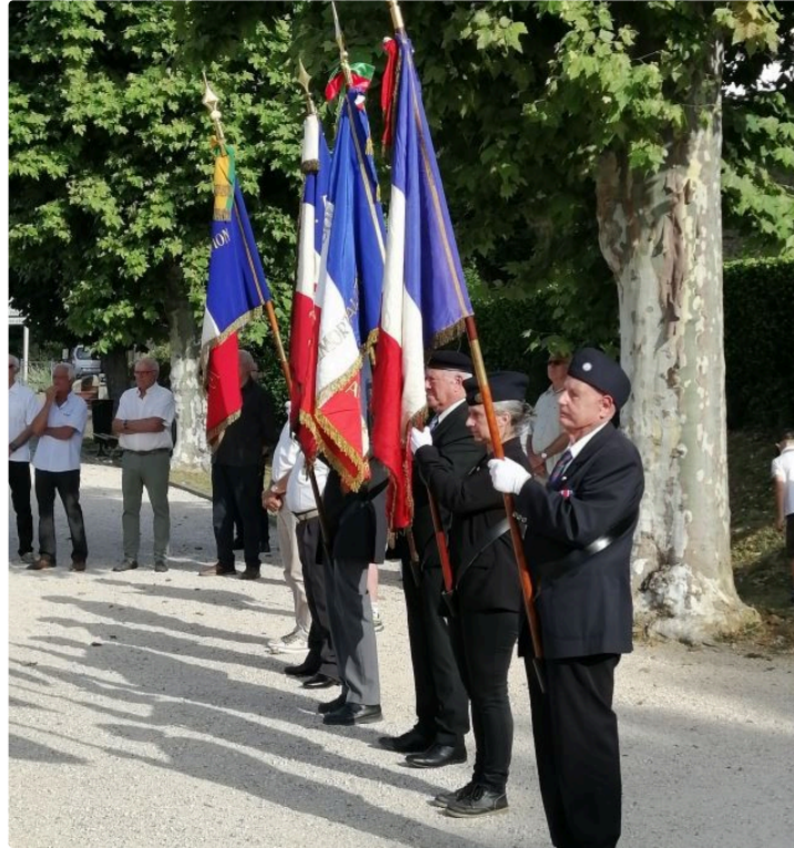
Ne pas oublier

Le 82ème anniversaire de l'appel à la résistance du Général Charles de Gaulle lancé depuis Londres le 18 juin 1940 a été commémoré samedi à Mirande en tout début de matinée en raison des fortes chaleurs annoncées. Il s'agissait de se souvenir de l'appel lancé sur les ondes de Radio-Londres où le Général de Gaulle appelait les Français à refuser la défaite et à poursuivre le combat aux côtés de nos alliés Anglais qui résistaient vaillamment aux armées hitlériennes.