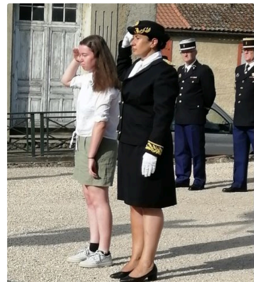
mirande 18 6 4.JPG