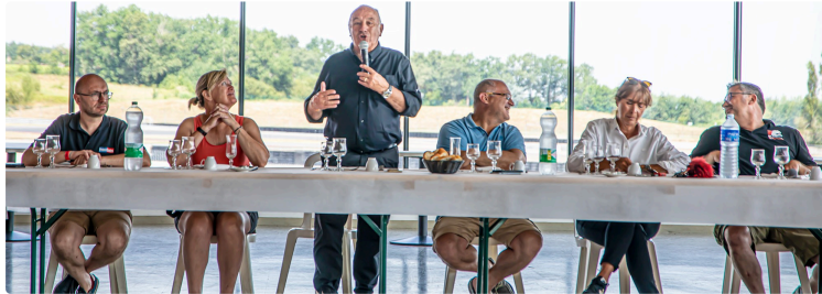
Grand Prix Camion au circuit de Nogaro : 3 jours de fête

Parades de camions décorés ; spectateurs des courses sous vigilance sanitaire canicule