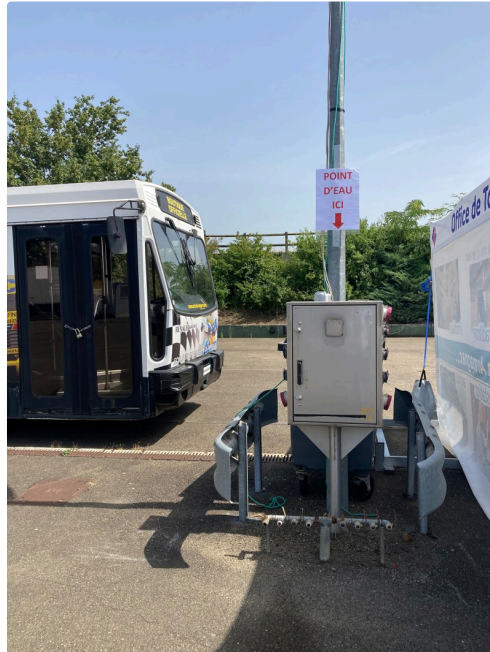
Un des points d'eau