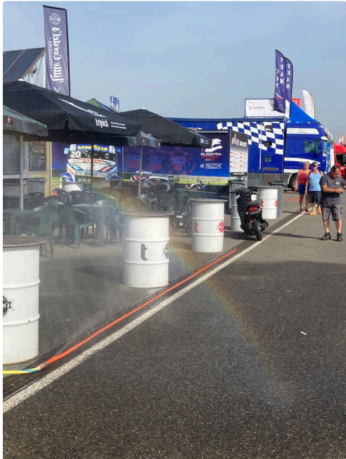
Ligne de brumisateurs