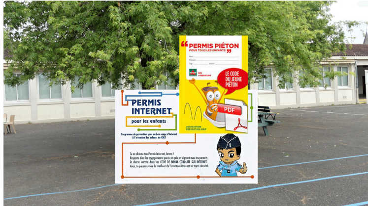
Permis piéton et permis internet pour les élèves de l'école Jean Jaurès de Pavie