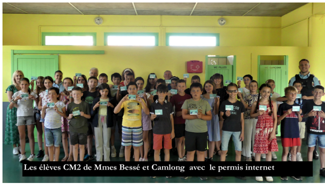
Les élèves CM2 de Mmes Bessé et Camlong avec le permis internet

Le "Permis Internet pour les enfants" est un programme national de prévention pour un usage d'Internet vigilant, sûr et responsable à l'attention des élèves de CM2 et de leurs parents.