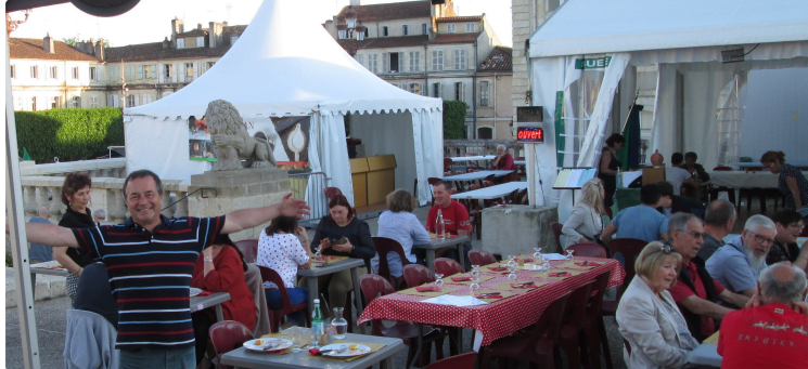
Venez vivre la dolce vita avec le village italien à Vic !

Vic-Fezensac accueille à partir du samedi 18 juin le village italien de l'associazione Villart qui s'installera place de la Poste jusqu'au 26 juin de 10 h à 20 h.