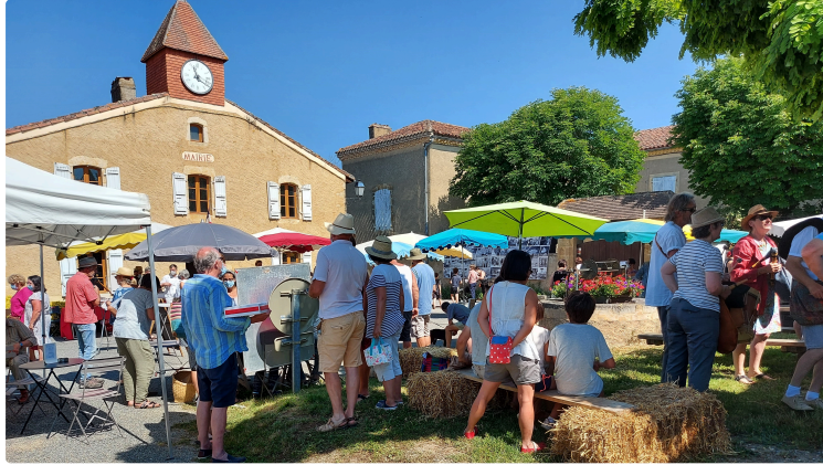
Les fromagers aux remparts, c'est ce dimanche !

Dimanche 12 juin, de 9 h à 13 h, ce sera la 19 ème édition du marché de producteurs « Les fromagers aux remparts » dans le pittoresque village de Saint-Arailles.